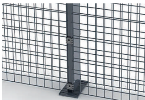
Les poteaux Zenturo avec plaque soudée (jusque h. 2,0 m) disponibles sur demande