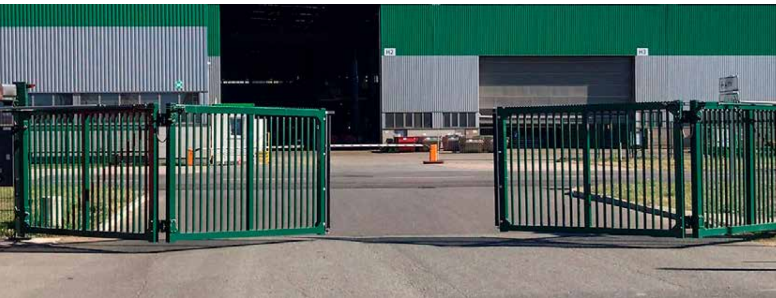
Portail escamotable rapide Faldivia