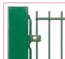
Poteau avec strip de fixation