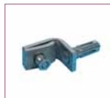
Pièce pour fixer la clôture au portail